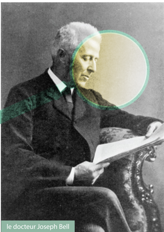
le docteur Joseph Bell